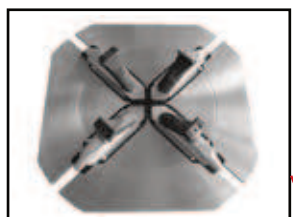
grande table de fixation pour une prise jusqu'à 28" de diamètre de jante