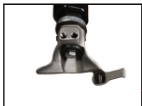
tête de montage robuste et usinée avec précision