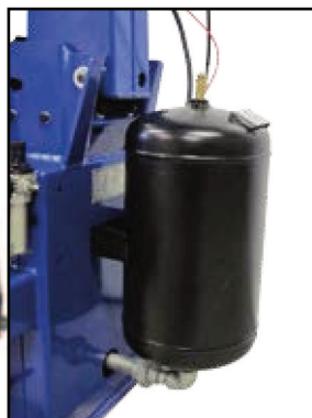
Booster de gonflage intégré