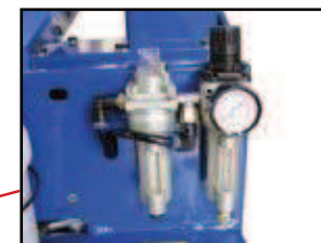
unité d'entretien avec un séparateur d'eau et un graisseur