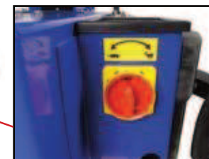
sélecteur de vitesse