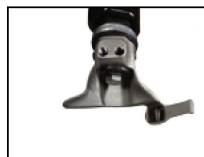
tête de montage robuste et usinée avec précision