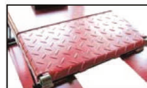
rampes d'accès verrouillables