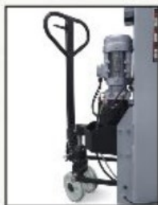
Kit mobilité intégré pour le déplacement du pont