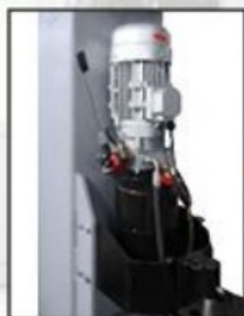
Puissante unité hydraulique