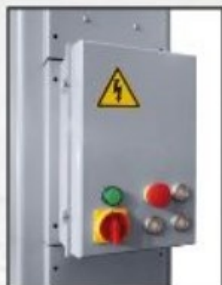
Pupitre de commande 24v avec interrupteurs électroniques de fin de course