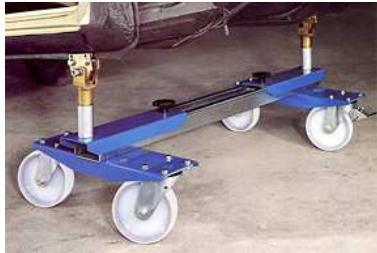
Art. 103 - Push Pull Pincés pour ancrage